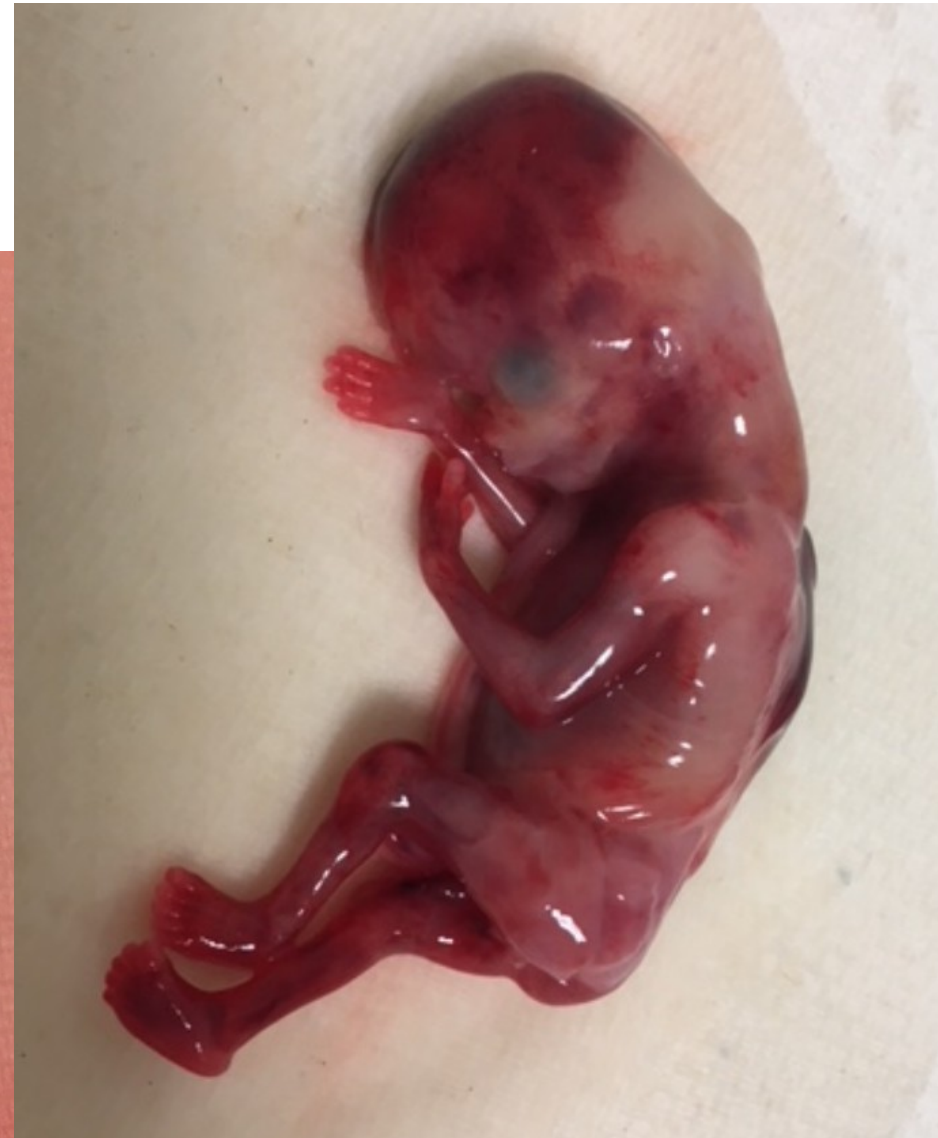
Fœtus 13/14 SA (LCC 90 mm)